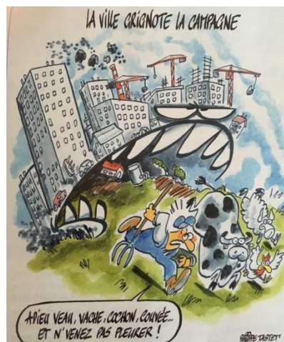
Doc 2 : caricature de Taster : « La ville grignote la campagne »