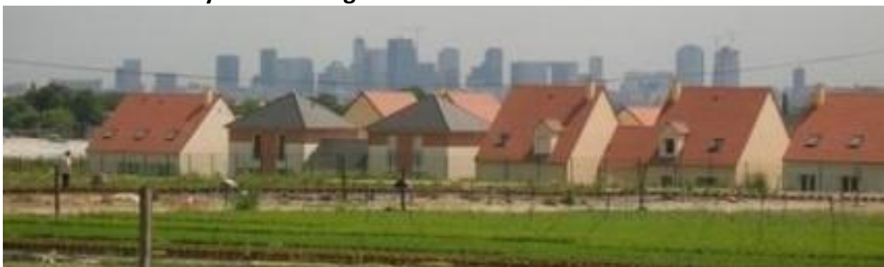
Doc 1 : vue du quartier de La Défense, depuis la ville de Montesson